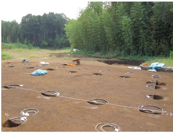
2009年荒追遺跡発掘風景

なぜか、根戸城跡は、松ヶ崎城跡に形が似ています。 その根戸城跡の台地の下は、かつては手賀沼が迫っていたと思われます。 町場から城跡まで、一緒に中世の遺跡群をめぐってみましょう。